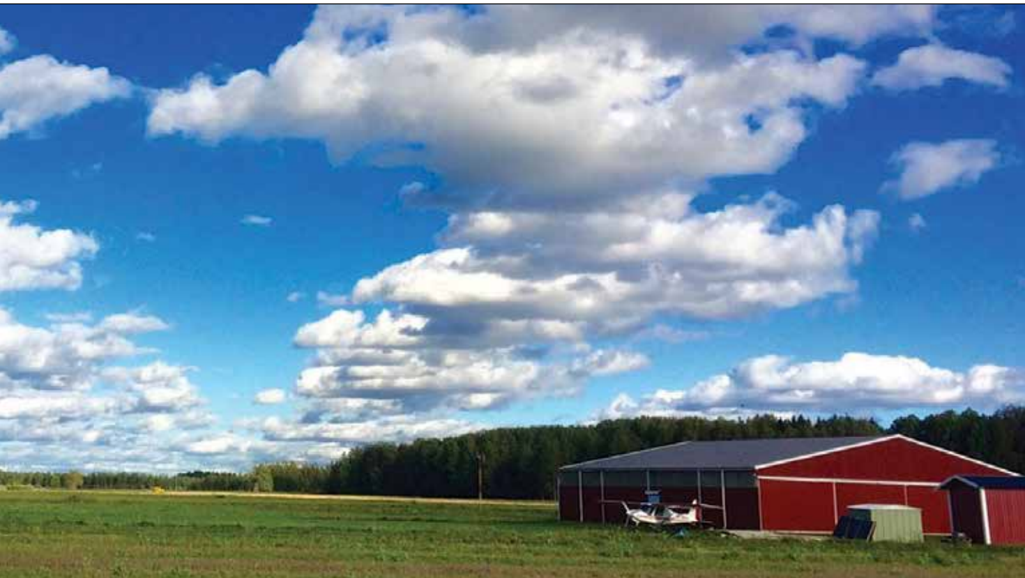
Uudenkylän Savikon pienkonelentokenttä, taustalla Helsinki - Hämeenlinna moottoritie, vasemmalla kiitorata, keskellä toisen hallin toistaiseksi tyhjä rakennuspaikka, oikealla pieneksi jäänyt ensimmäinen halli.