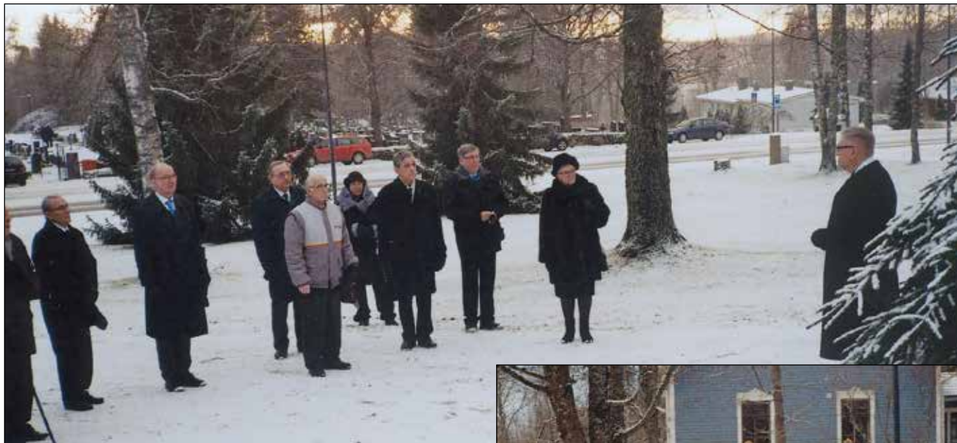
Sovintopuiston muistolaatan paljastus 6.12.2017.

lÄkirjatoimikuntaa. Jokaisella taholla aloitteisiin suhtauduttiin alusta alkaen innostuksella ja lÄmminhenkisellä kotiseuturakkaudella.