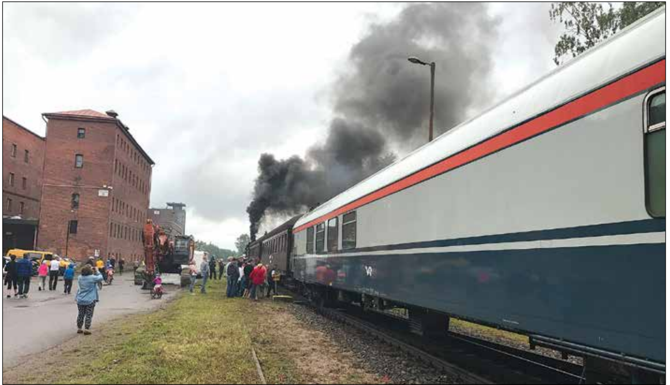
Juna pysähtyi myös Rajamäellä.

kaan aikaisemmin noussut yhtä aikaa näin paljon matkustajia kuin nyt. Näytti siltä, että nousijoita oli pitkälti yli sadan.