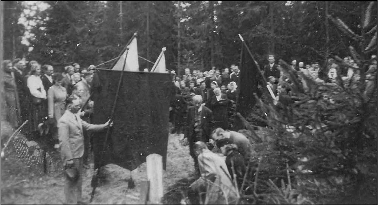
Ketunnummen haudalla 1945-46.

”Vuosi 1923 on ollut hyvin merkityksellinen äidin ja isän yhteisen elämän alkuvaiheissa. He ostivat Tuomisto-nimisen torpan Lahtisen perheeltä. Lahtinen oli ollut alun perin torpan perustaja ja raivaaja. Torppa oli aikoinaan erotettu Numlahden kartanon maista.”