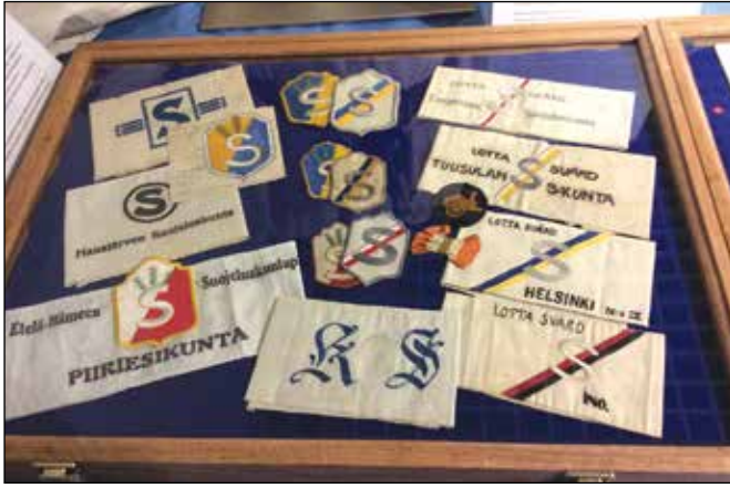
Suojeluskunta- ja lottatunnuksia.

vinen uni oli tosiasia vuonna 1939 .Ei nähty uhan merkkejä, synkkiä pilviä kaakonkulmalla.