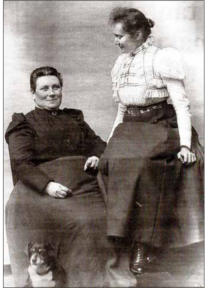
Lucina Hagman luottoystävänsä, runoilija Hedvig von Schantzin kanssa. Kuvassa myös Pikku-koira, joka oli Siinan lemmikki 17 vuoden ajan.