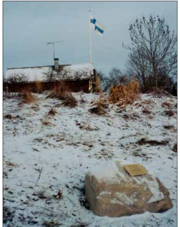
Säveltaiteilija Bernhard Herman Crusellin muistolaatta itsenäisyyspäivänä Perttulan nuorisoseurantalo Rientolan edustalla. Paikka on jokseenkin sama, millä alkuperäinen Perttulan talo sijaitsi.

Nurmijärvi-Seura esittää Nurmijärven kunnalle, Nurmijärven seurakunnalle, Nurmijärven Opistolle ja Nurmijärven Musiikkiopistolle yhteiseksi hankkeeksi merkitä muistolaatalla tämän ainut-