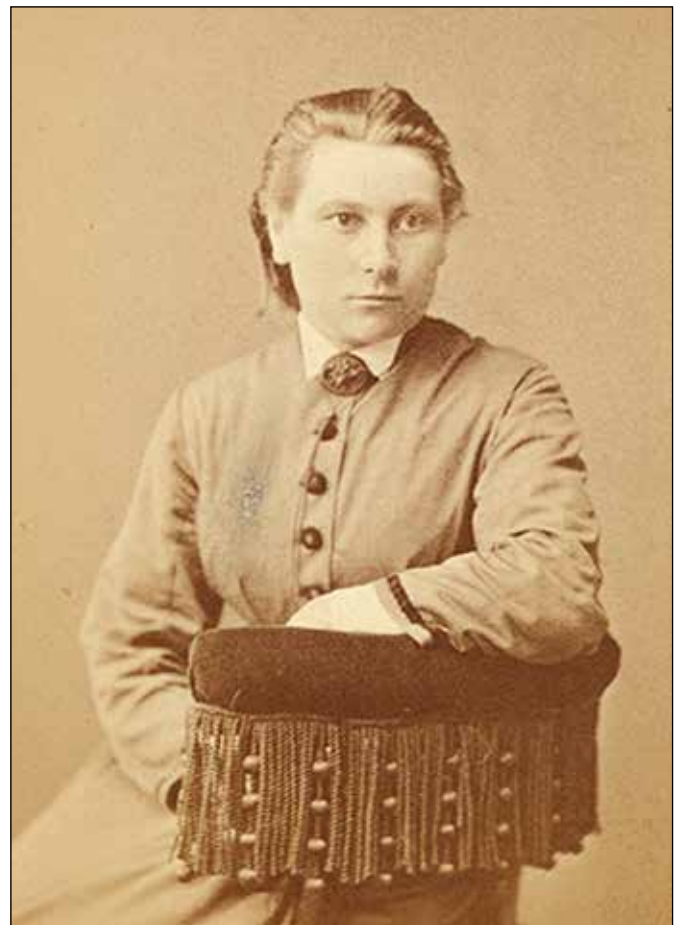
Lucina Hagman vuonna 1875 valmistuttuaan kansakoulun opettajaksi.

dyn kyselyn tulos oli, että martat edustavat aktiivista, toimeliasta ja osallistuvaa naiskuvaa. He ovat myös uudistusmielisiä. Marttajärjestö ei ole vain naisille. Myös martit osallistuvat. Heitä kuuluu järjestöön jo useampi tuhat. Yhteistyötä on tehty yhteisen hyvän eteen, sillä lasten ja nuorten syrjäytymistä estää osaltaan kotien hyvinvointi ja turvallinen arki.