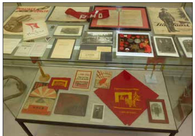
Maamme historia on suurelta osaltaan myös sotahistoriaa. Sodat ja niiden seuraukset ovat muokanneet niin kansan luonnetta kuin kehitystä.