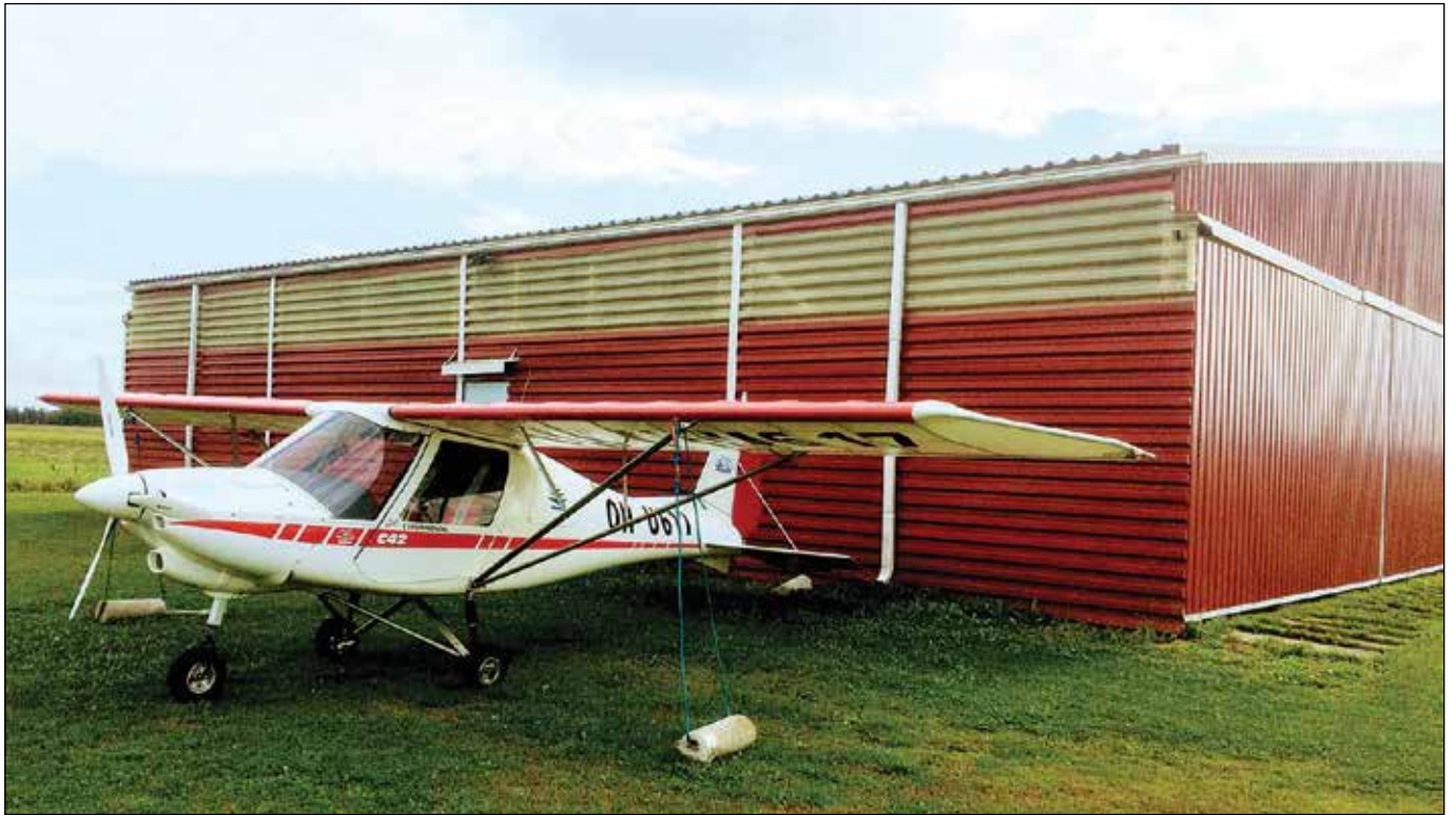
Savikon pienlentokonehalli ja tilanpuutteen takia hallin ulkopuolelle jäänyt Ikarus 42 - merkinen ultrakevyt lentokone.