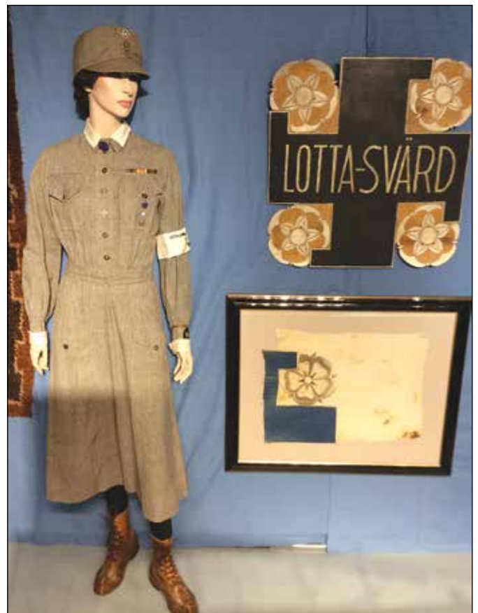
Lottapuku ja –tunnus.

Pienenä oheishyötynä olemme voineet tukea paikallista sotiemme veteraanien huoltotyötä mm veteraanien kotihoidon osalta. Kävijät ovat voineet halutessaan ostaa veteraanien tai sotainvalidiemme tueksi myytäviä esineitä tai tehdä suoraan pieniä lahjoituksia.