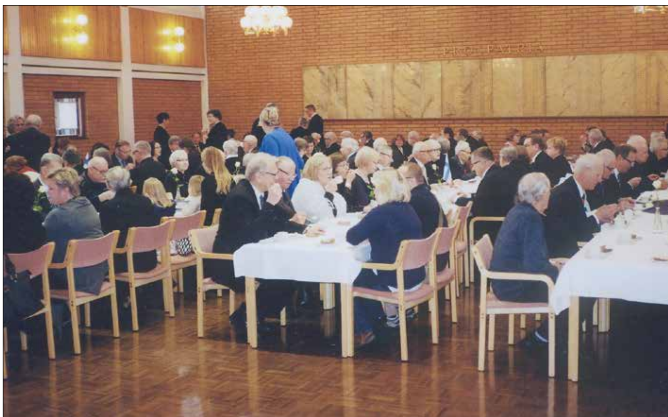
Nurmijärveläisiä juhlistamassa isänmaan 100-vuotista itsenäisyyttä Nurmijärven seurakuntakeskuksessa itsenäisyyspäivänä 2017.