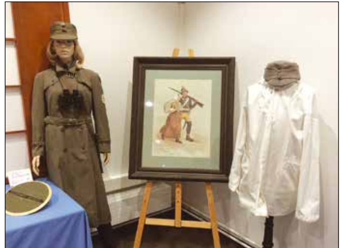
Suojeluskunnilla ja Lottajärjestöllä on ollut suuri merkitys Suomen itsenäisyyden puolustamisessa.

sotaan saakka. Uhka yhdisti ja Suomi taisteli saaden sisukkuudestaan mainetta. Ruotsalaiset, mihin itseämme miellämme vertaamme, tietyllä tavalla kadehtivat sotahistoriaamme. Virolaiset taas kadehtivat sodan kautta varmistettua itsenäisyyttämme.