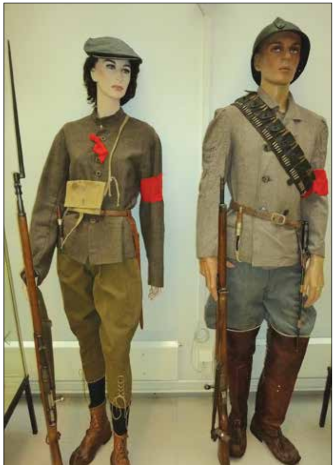
Punakaartilaisten asuja ja aseistusta vuodelta 1918.